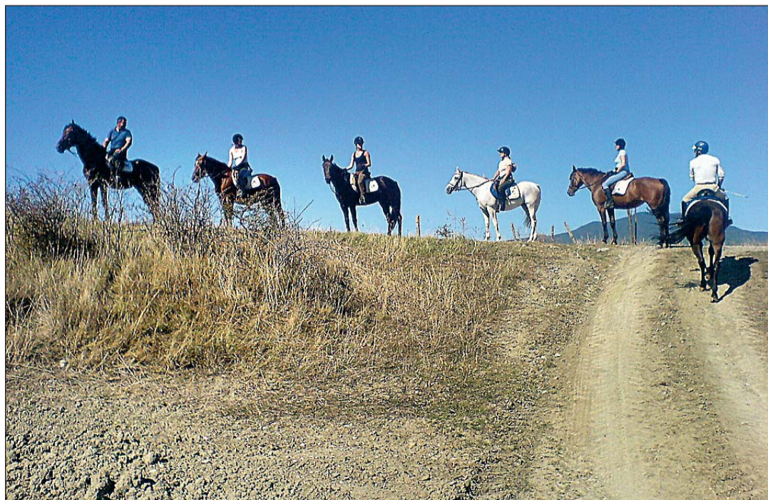
På ridetur: Her er jentene med guide på ridetur.