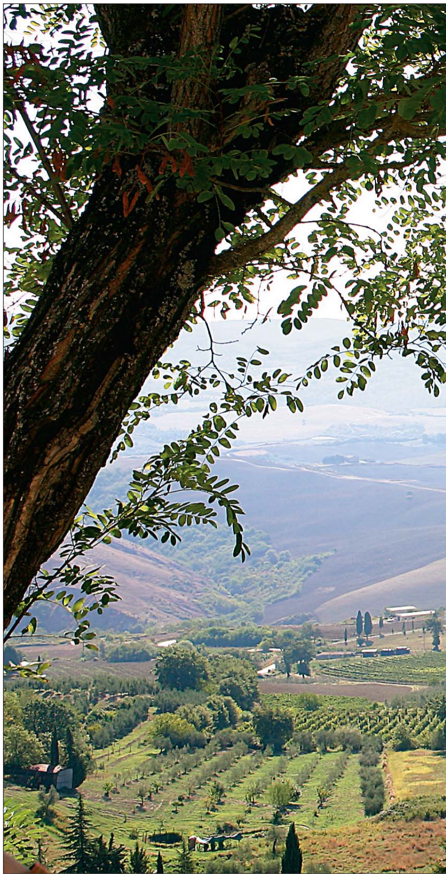
Utsikt: Det var nydelig utsikt til flotte omgivelser fra gården.